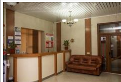
Гостиница. Ресепшн гостиницы, в котором проживала спикер