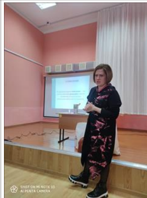
Теоретическая часть тренинга Теоретическая часть тренинга 15.03.2021г. Майкоп, Актный зал АРШИДНСИЗ (корпус слабовидящих)