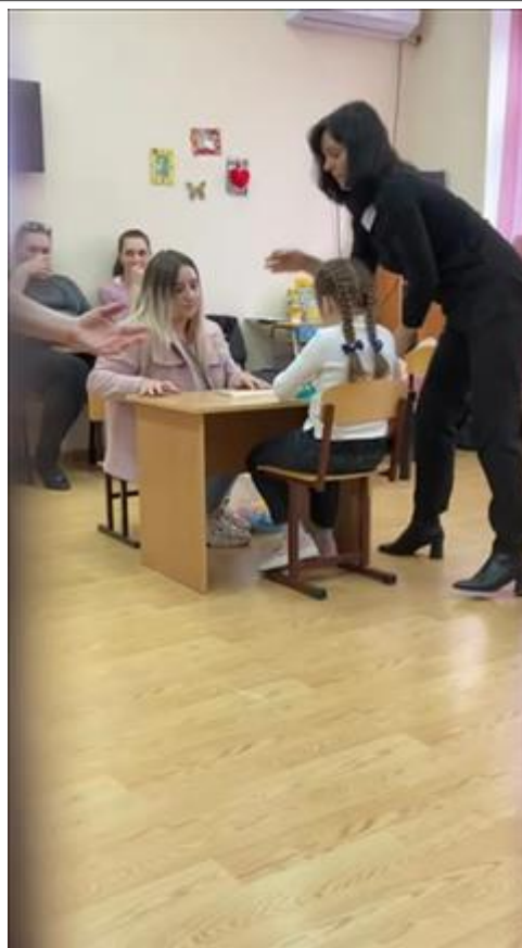
Практическая часть тренинга Практическая часть тренинга. Майкоп, зал групповых занятий, АРШИДНСиЗ (корпус слабовидящих)