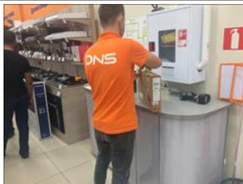
Фотография покупки ноутбука Покупка ноутбука, согласно проекту