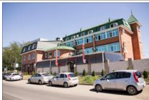
Фотография гостиницы Здание гостиницы, в котором проживала спикер во время проведения мероприятий