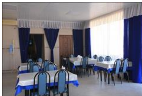
Гостиница. Столовая Столовая гостиницы, в котором проживала спикер