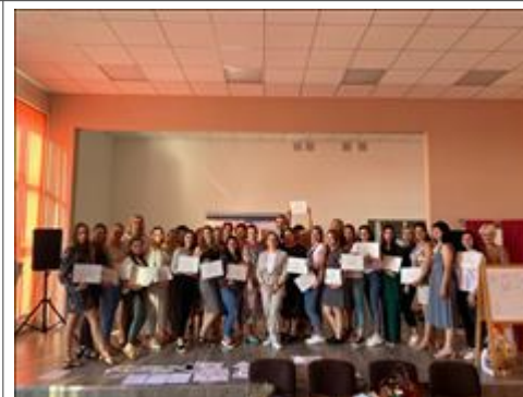
Общая фотография Общая фотография с врученными свидетельствами после Семинара-практикума.12.09.2020 г. Майкоп, Актный зал АРШИДНСИЗ (корпус слабовидящих)