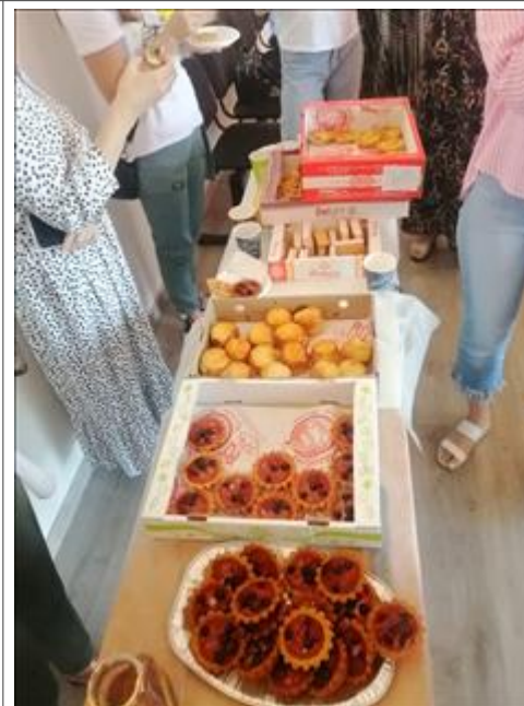
кофе-брейк Продукты для участников семинара на кофе-брейк