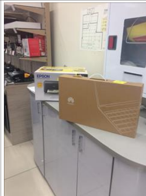
Принтер и ноутбук Фотография принтера и ноутбуке в Гипермаркете DNS