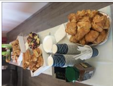
Кофе-брейк Продукты для кофе-брейка