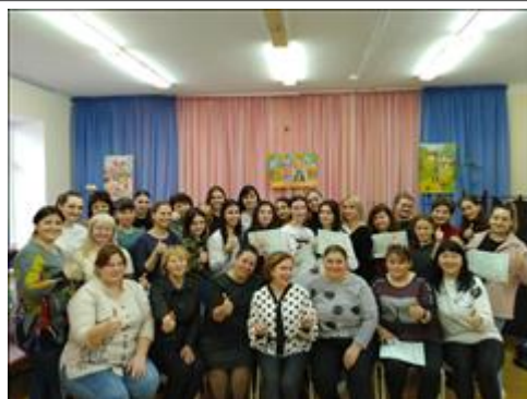
Общая фотография по окончании тренинга На общей фотографии не все участники -родители и некоторые тьюторы не смогли дождаться до конца вручения.