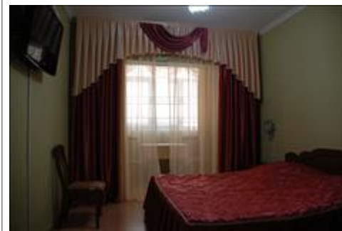
Номер гостиницы. Сентябрь Номер гостиницы, в котором проживала спикер в сентябре