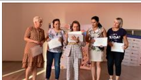
Вручение свидетельств Вручение свидетельств по окончании Семинара-практикума. 12.09.2020 г. Майкоп, Актный зал АРШИДНСИЗ (корпус слабовидящих)

Мероприятие: Базовый практический очный тренинг по АВА-терапии (с участием детей с РАС). Мероприятие прошло в г. Майкопе, в Актном зале АРШИДНСИЗ (корпус для слабовидящих) с переходом в зал для групповых занятий.