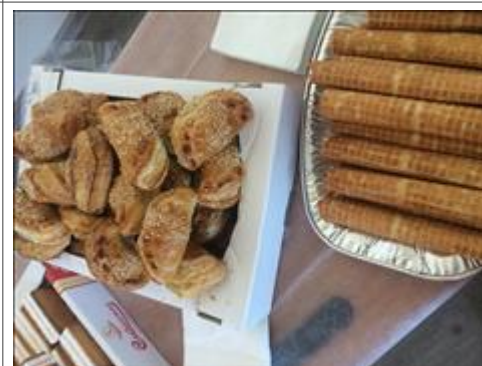
кофе-брейк Продукты для кофе-брейка