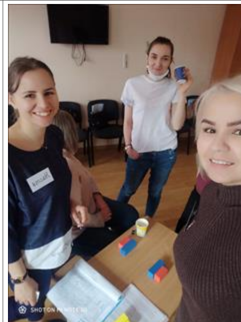
Практическая часть тренинга Практическая часть тренинга. Майкоп, АРШИДНСиЗ, март 2021 г.

Мероприятие: Бронирование билета на самолет в обе стороны -Самара-Краснодар и обратно.Бронирование гостиницы. Проверка состояния гостиницы, меню завтрака.З