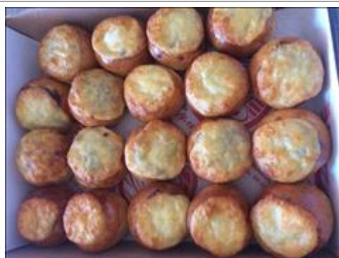
кофе-брейк Продукты для участников семинара на кофе-брейк. Майкоп, 11 -12 сентября 2020 г. Актовый зал АРШИДНСиЗ

Мероприятие: Вводная лекция "Базисные принципы Прикладного Анализа Поведения. Что такое АВА-терапия?"