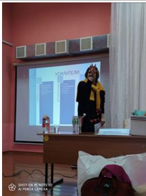
Теоретическая часть тренинга Теоретическая часть тренинга.15.03.2021 г. Майкоп, Актовый зал АРШИДНСиЗ (корпус слабовидящих)