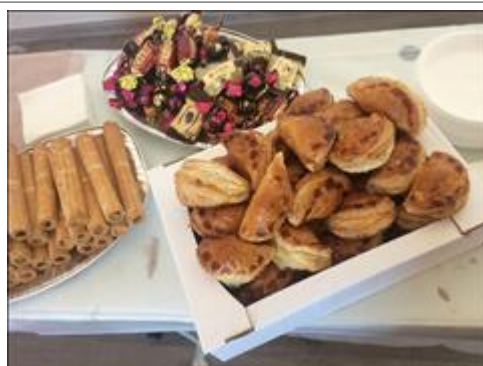
Кофе-брейк Продукты для кофе-брейка