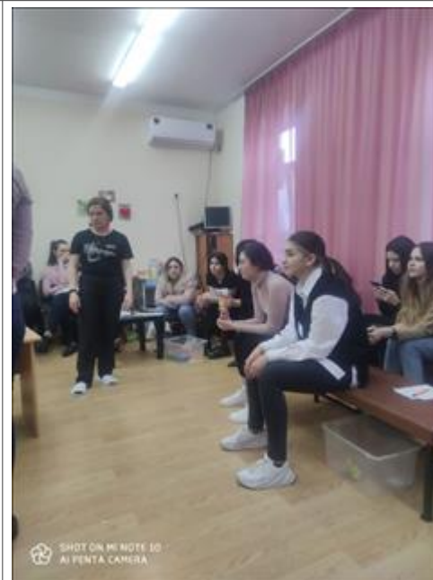
Практическая часть тренинга Практическая часть тренинга. 16.03.2021 г. Майкоп, зал групповых занятий, АРШИДНСиЗ (корпус слабовидящих)