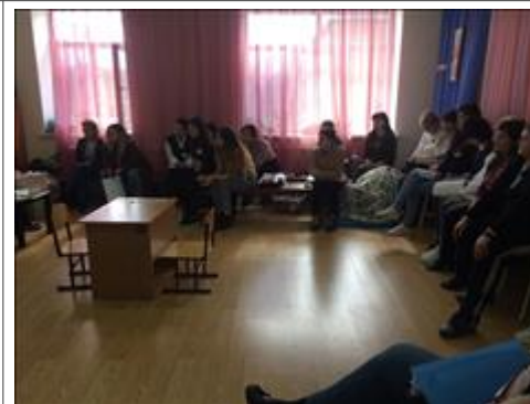
Подготовка участников тренинга к работе с ребенком Спикер делит участников на группы, дает инструкции