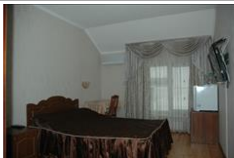
Номер гостиницы. Март Номер гостиницы, в котором проживала спикер в марте 2021 г