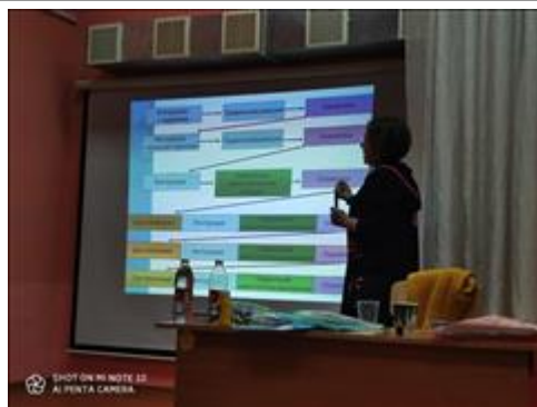
Теоретическая часть тренинга Теоретическая часть тренинга.15.03.2021г. Майкоп, АРШИДНСИЗ (корпус слабовидящих)